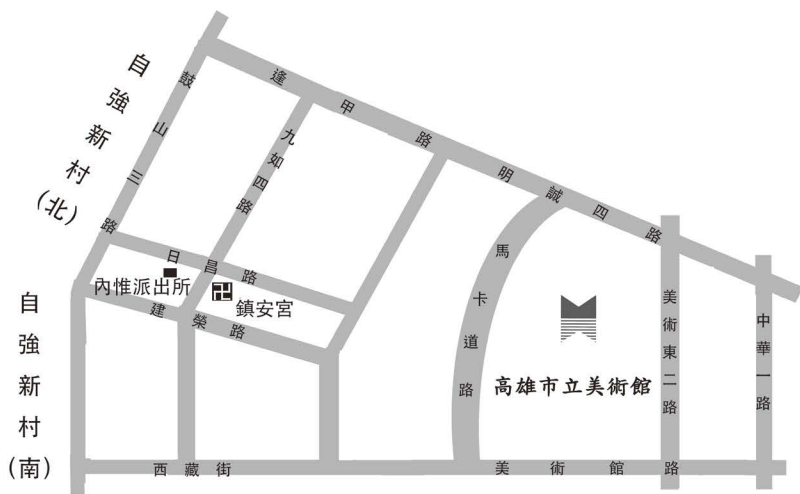
圖一 高雄市立美術館周邊地圖